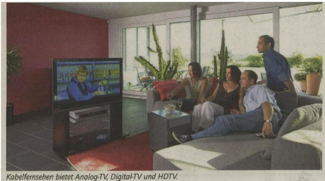
Kabelfernsehen bietet Analog-TV, Digital-TV und HDTV.

W er an ein Kabelnetz angeschlossen ist, kann sicher sein, auch in Zukunft gut bedient zu werden. Denn Kabelnetze bieten schon heute, was Glasfasernetze erst für Morgen versprechen. Der Grund dafür ist, dass Kabelnetze zum grössten Teil aus Glasfaserkabeln bestehen. Nur das letzte Stück bis zum Haus besteht aus Koaxialkabeln, die den Glasfaserkabeln fast ebenbürtig sind.